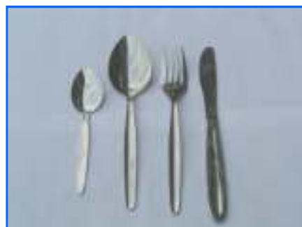
Couvert à la pièce

Disponibilité + ou - 500 pièces de chaque