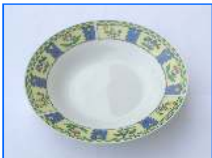
Assiette creuse 20,50 cm