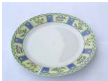
Assiette plate 23,00 cm