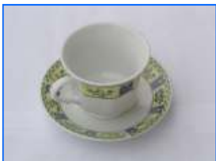
Tasse ou sous-tasse

Disponibilité + ou - 500 pièces de chaque