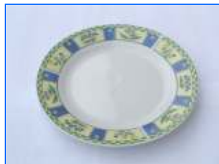
Assiette dessert 19,00 cm